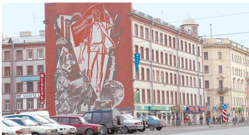
К брандмауэрной стене дома по пр. Стачек будет пристроен небольшой магазин

По мнению специалистов КГА, проводить торги на право застройки участка, расположенного на проспекте Стачек, экономически нецелесообразно. Кроме небольшого магазина, возвести здесь что-либо вряд ли удастся. В соответствии с функциональным зонированием территории участок отнесен к общественно-деловой зоне. Проектированием объекта уже занимается «Архитектурная мастерская А.В. Мельниченко». В письме к инвестору КГА указал на то, что сегодня отсутствует градостроительная документация о планировке территории, ограниченной проспектом Стачек, Старо-Петергофским проспектом, продолжением Сивкова переулка и улицей Ивана Черных (частично эта территория