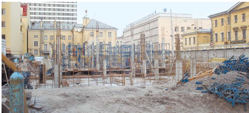
Для налоговой инспекции на Лермонтовском проспекте будет построено здание

Отодвигается срок сдачи в эксплуатацию гостиницы на набережной реки Фонтанки. Это здание должна освободить Федеральная налоговая служба, переехав на Лермонтовский проспект. ООО «АвтоКомБалт» вышло на городское правительство с инициативой