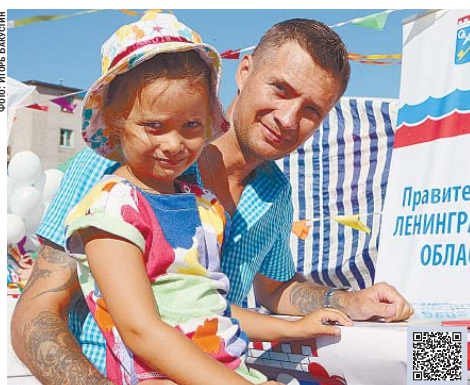
День рождения Ленинградской области