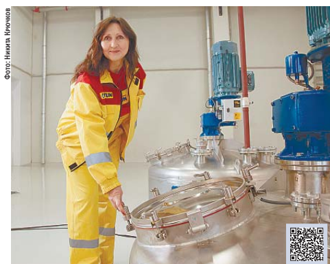
Открытие лакокрасочного завода «Йотун Пейнтс»