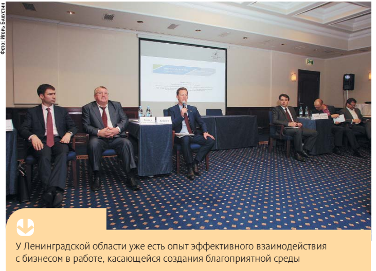
У Ленинградской области уже есть опыт эффективного взаимодействия с бизнесом в работе, касающейся создания благоприятной среды

«В то же время подход должен быть взвешенным и рациональным, а не отражать только желания предприниматель-