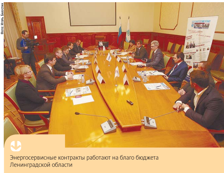
Энергосервисные контракты работают на благо бюджета Ленинградской области

«В ноябре 2014 года мы отметили пятилетие с момента принятия Федерального закона № 261-ФЗ об энергосбережении и энергоэффективности. За эти годы много удалось сделать. Отрадно, что на