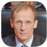
Владимир Драчев, глава администрации Всеволожского района:

В преддверии наступающего 2015 года от всей души желаю всем жителям Волховского района крепкого здоровья и большого личного счастья!