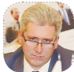
Андрей Гаврилов, председатель Комитета по топливно-энергетическому комплексу Ленинградской области