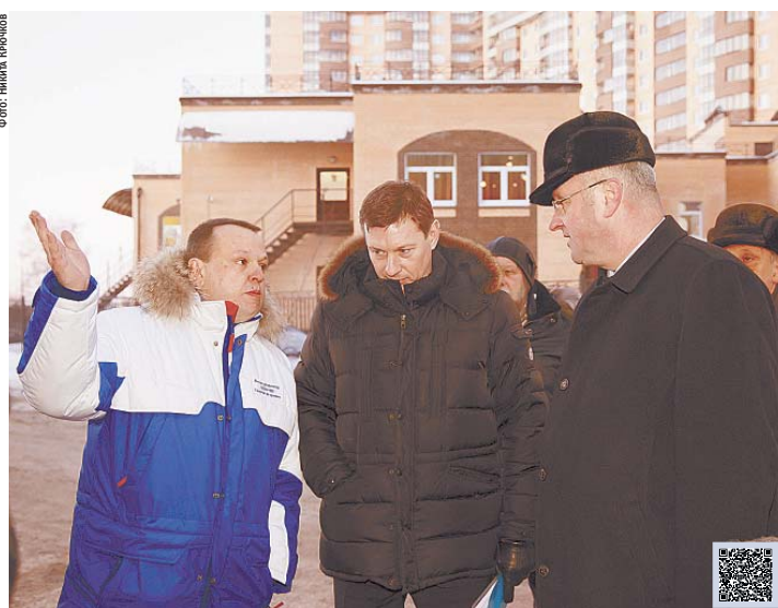
Рабочая поездка вице-губернатора Георгия Богачева в Новое Десяткино