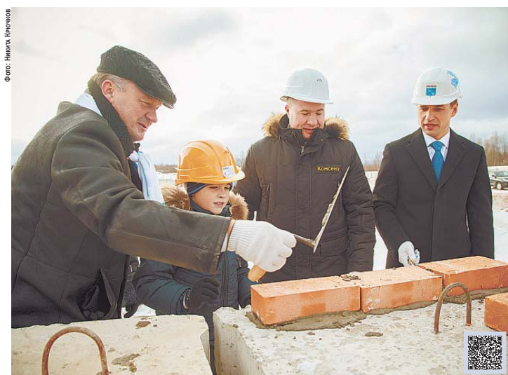
Торжественная закладка первого камня в основание будущей школы в пос. Вознесенье Подпорожского района Ленинградской области