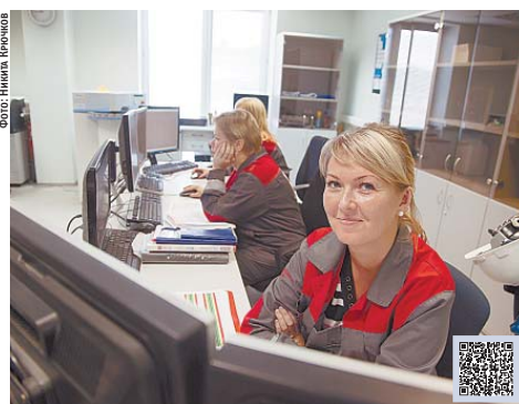
Завод «ЛСР. Цемент», город Сланцы, Ленинградская область