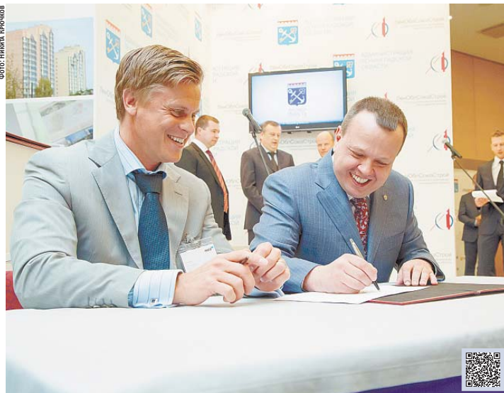
Форум «Девелопмент и строительство в Ленинградской области»