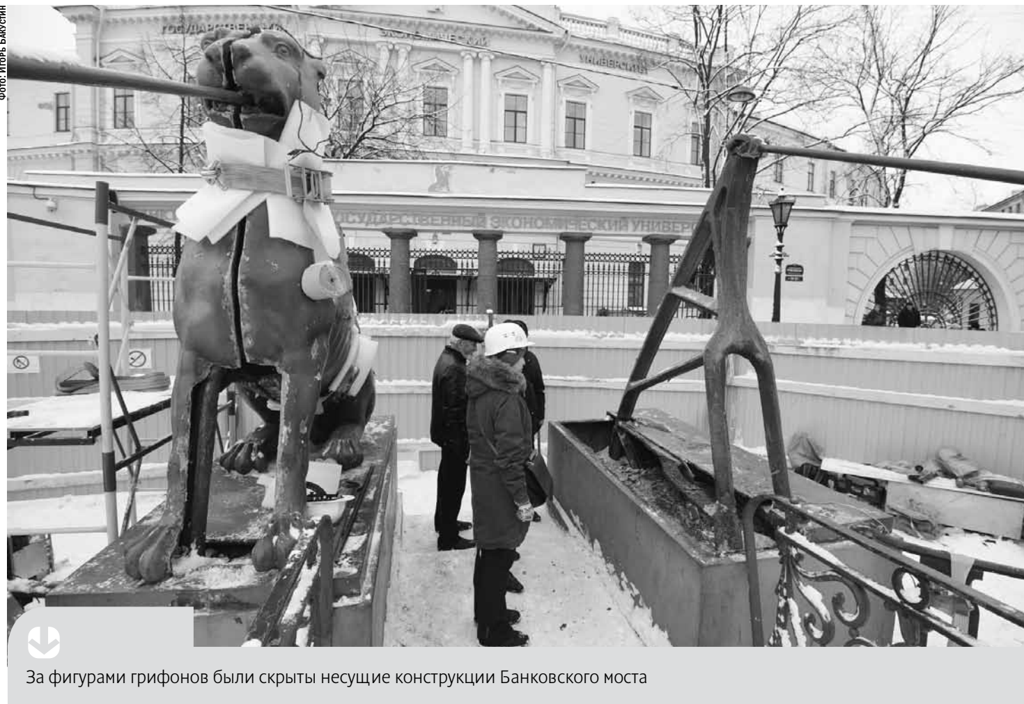
За фигурами грифонов были скрыты несущие конструкции Банковского моста

Анастасия Лаптёнок / Грифоны с Банковского моста демонтированы и отправлены на реставрацию. Лоск скульптурам «крылатых львов» вернут за 19 млн рублей. Реставрационные работы профинансирует Северо-Западный банк ПАО Сбербанк. ➔