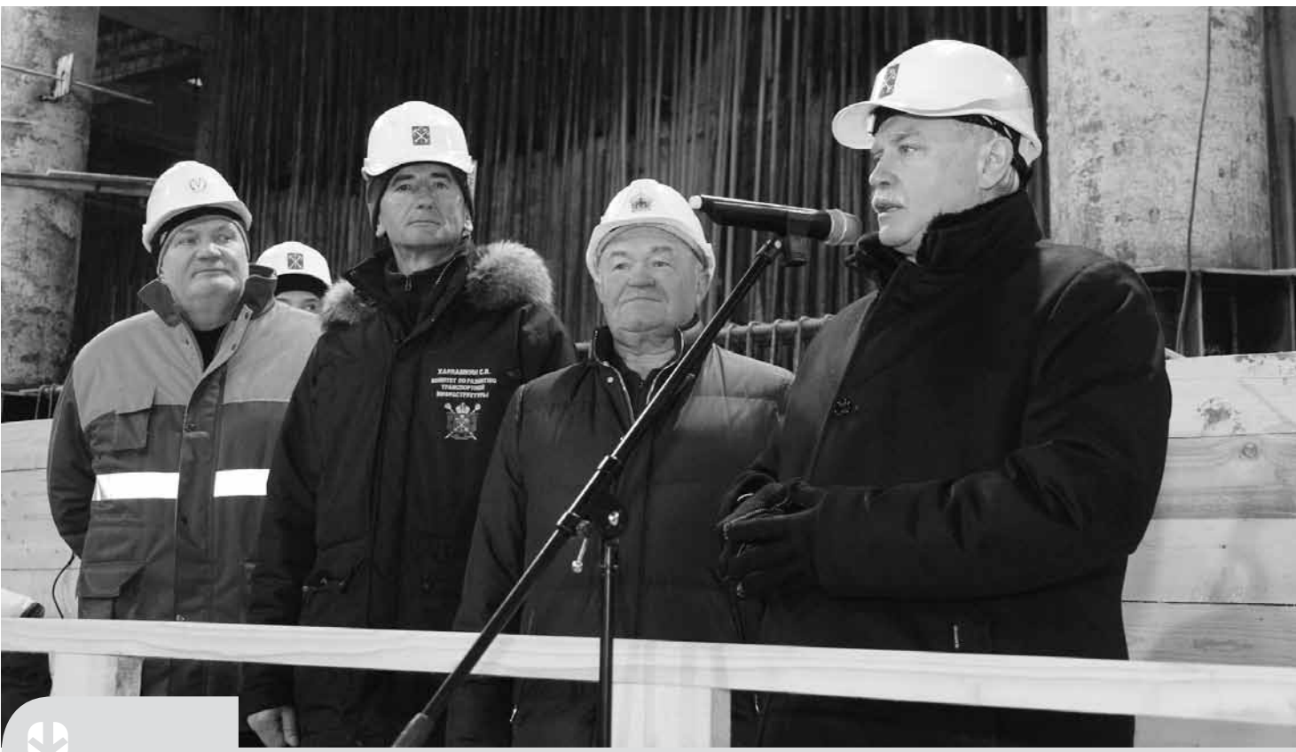
На церемонии завершения проходки побывал губернатор Петербурга Георгий Полтавченко