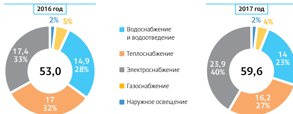
Объем капиталовложений (2016 и 2017 годы), млрд рублей