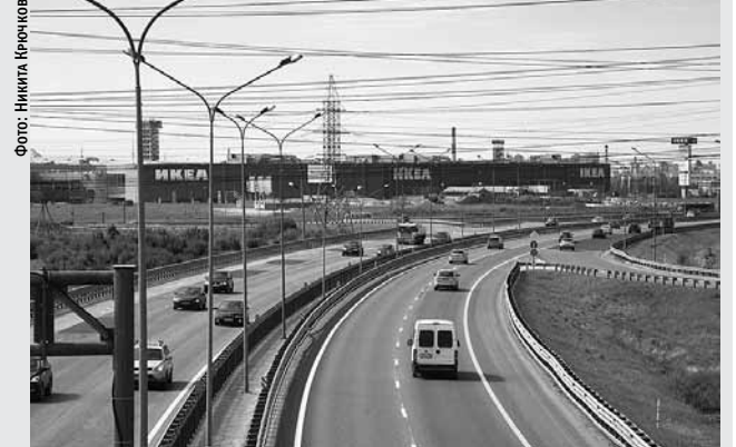
ИКЕА намерена построить свою развязку

Максим Еланский / Проект планировки территории под будущий транспортно-пересадочный узел «Кудрово» не могут завершить без его синхронизации с проектом транспортной развязки, которую рядом собирается строить шведский ритейлер IKEA.